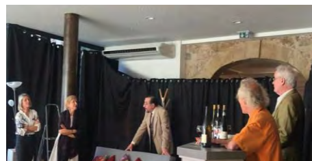
Théâtre à la salle de "Rencontre"